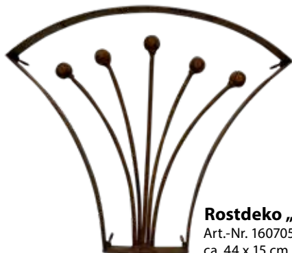
Rostdeko „Rustic flower“